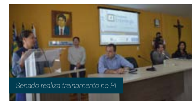
Senado realiza treinamento no PI

Cerca de 70% das Câmaras Municipais do Piauí não têm acesso à internet. Para ajudar os Poderes Legislativos a se adequarem à Lei de Acesso à Informação, o Senado Federal, por solicitação da senadora Regina Sousa, promoveu, em Parnaíba, oficinas de Apoio ao Processo Legislativo e sobre o Portal Modelo para internet.