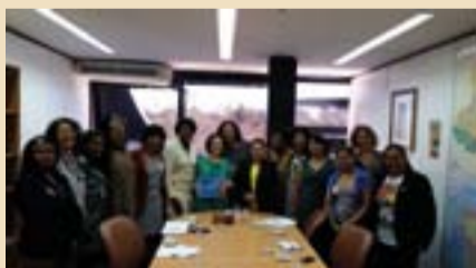
Marcha das Mulheres Negras acontecerá no dia 18 de novembro.