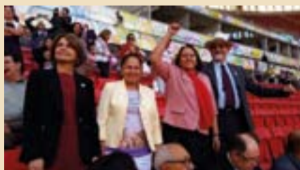
Senadores participam da Marcha das Margaridas em Brasília.