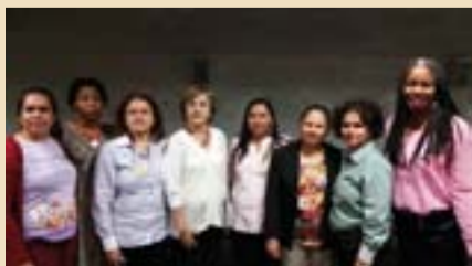
Movimentos Sociais defendem pautas femininas no Senado.