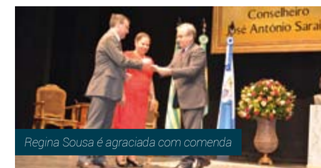
Regina Sousa é agraciada com comenda

A senadora Regina Sousa foi uma das 38 pessoas homenageadas pela Prefeitura de Teresina com a Medalha do Mérito Conselheiro José Antônio Saraiva. A solenidade foi realizada no Teatro 4 de Setembro, no dia 16 de agosto, como parte das comemorações dos 163 anos da capital.