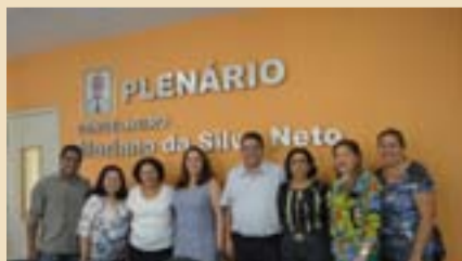
Regina Sousa visita Conselho Estadual de Educação do Piauí.