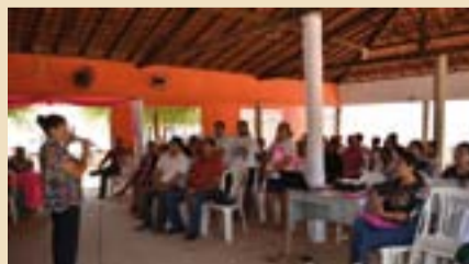
Senadora participa das conferências municipais de políticas para mulheres