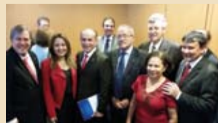
Marcelo Castro é prestigiado na posse como ministro da Saúde.